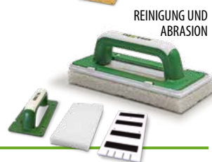
REINIGUNG UND ABRASION