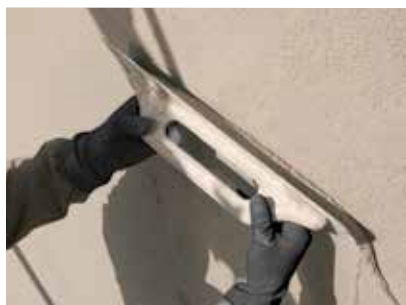
Acabado y decoración de Geocalce Tenace

→ Se aplica con paleta como un enfoscado o un mortero tradicional. Como enfoscado se aplica en obra respetando las buenas prácticas constructivas, con pasadas de 3 cm de espesor máximo.