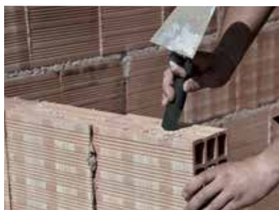
Geocalce Tenace aplicado a mano

→ Gracias a su plasticidad, puede ser proyectado con revocadora monofase o trifase equipada para la aplicación de un enfoscado común.