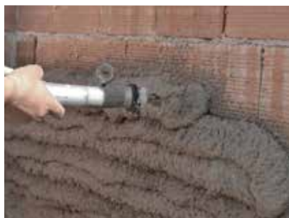
Geocalce Tenace aplicado con revocadora

→ Gracias a su plasticidad, puede ser proyectado con revocadora monofase o trifase equipada para la aplicación de un enfoscado común.