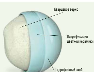
Каждое шаровидное зерно кварца покрыто тонким керамическим слоем и защищено путём гидрофобной обработки.