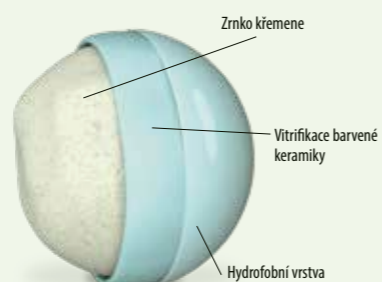
Každé sférické zrníčko křemene je pokryté tenkou vrstvičkou keramiky a je chráněno díky hydrofobní úpravě.