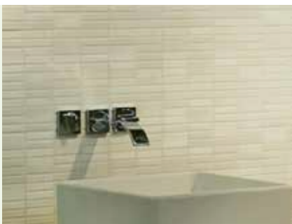
Dlouhodobě zaručená estetická a funkční stálost

Ekokompatibilní čistící prostředek pro aditivaci mycí vody pomocí přípravků Fugalite®, Fugalite® Invisible. Koncentrát, na vodní bázi, bez rozpouštědel, neškodný pro životní prostředí a zdraví pracovníků. Fuga-Wash Eco usnadňuje čištění obkladů, udržuje houbu co nejdéle čistou, zlepšuje povrchový vzhled tmelu a umožňuje snadnější pohyb houby bez vydření spáry.