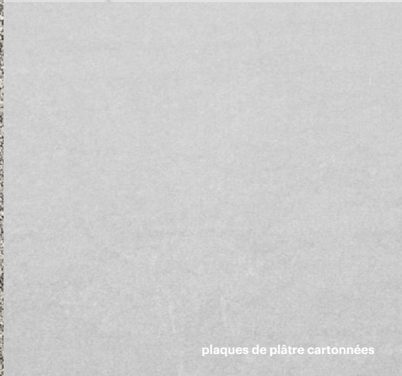
plaques de plâtre cartonées