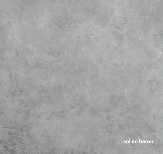
sol en béton