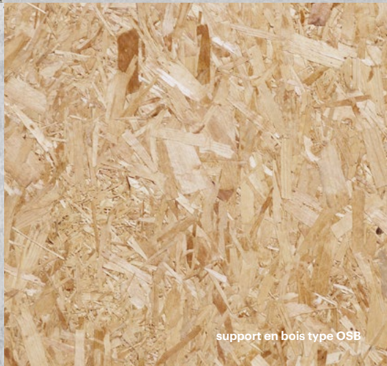
support en bois type OSB