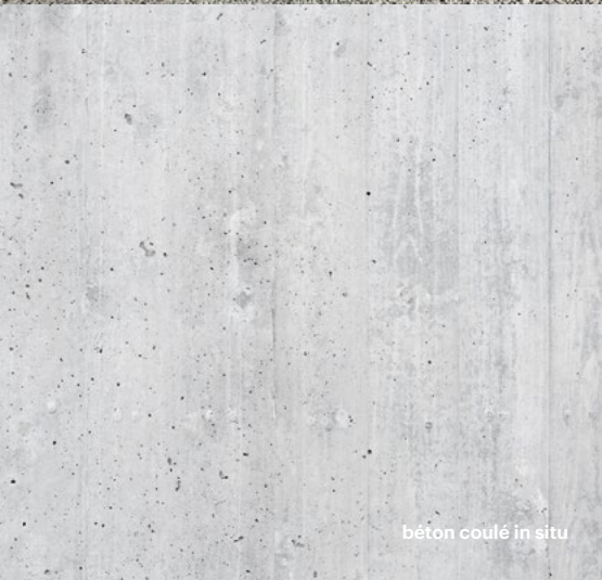
béton coulé in situ