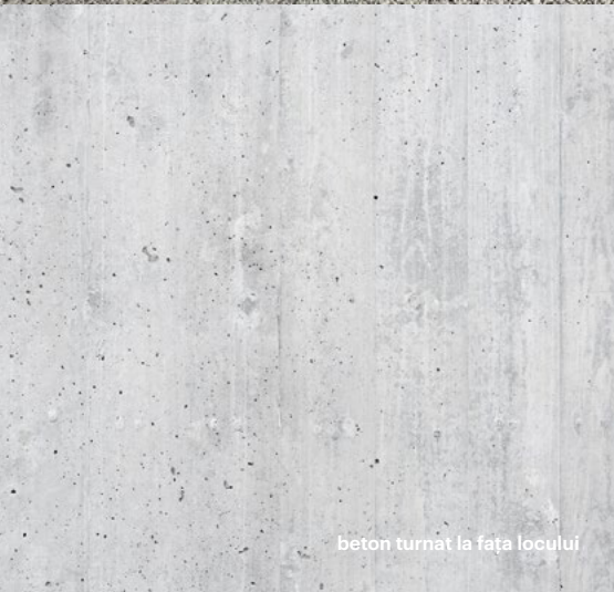
beton turnat la fața locului