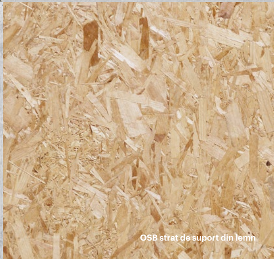
OSB strat de suport din lemn