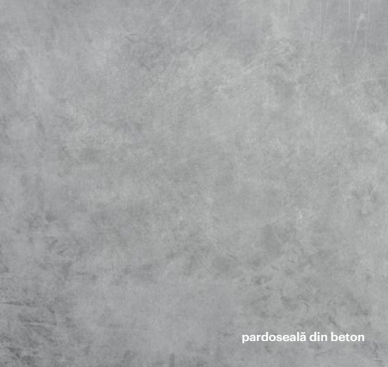
pardoseală din beton