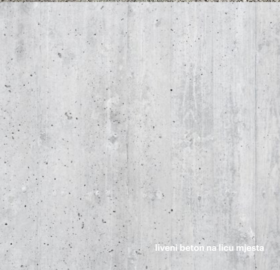
liveni beton na licu mjesta