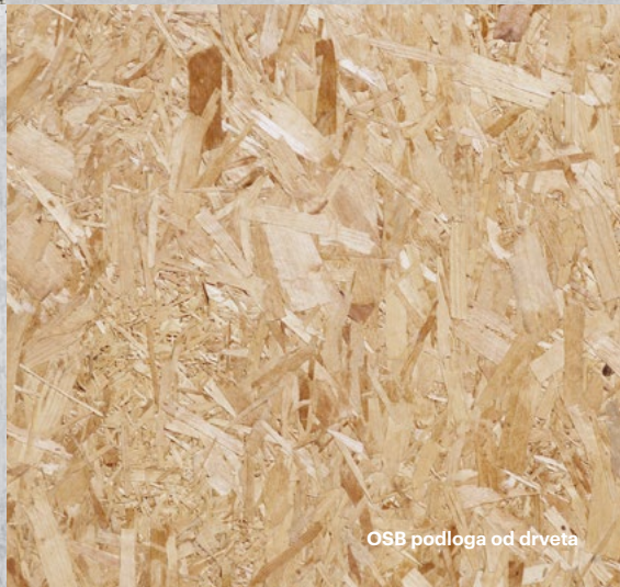
OSB podloga od drveta