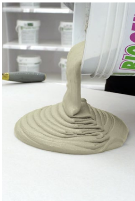
Tiksotropna in tekoča zmes

Biogel No Limits združuje odlično razmazljivost zmesi pod gladilko in zmožnost prenašanja teže ter ohranjanja oblike ob vgradnji, kar zagotavlja lažje delo na gradbišču in zanesljive rezultate.