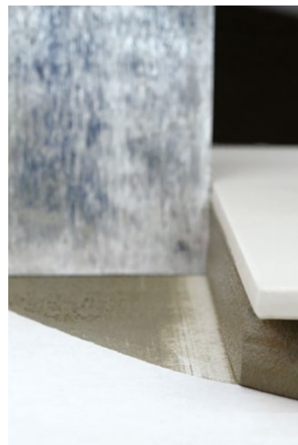
Se ne poseda