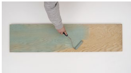
Nonos premaza Active Prime Fix ali Active Prime Grip