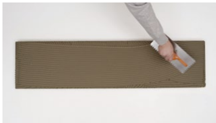
Razmaz lepila Biogel